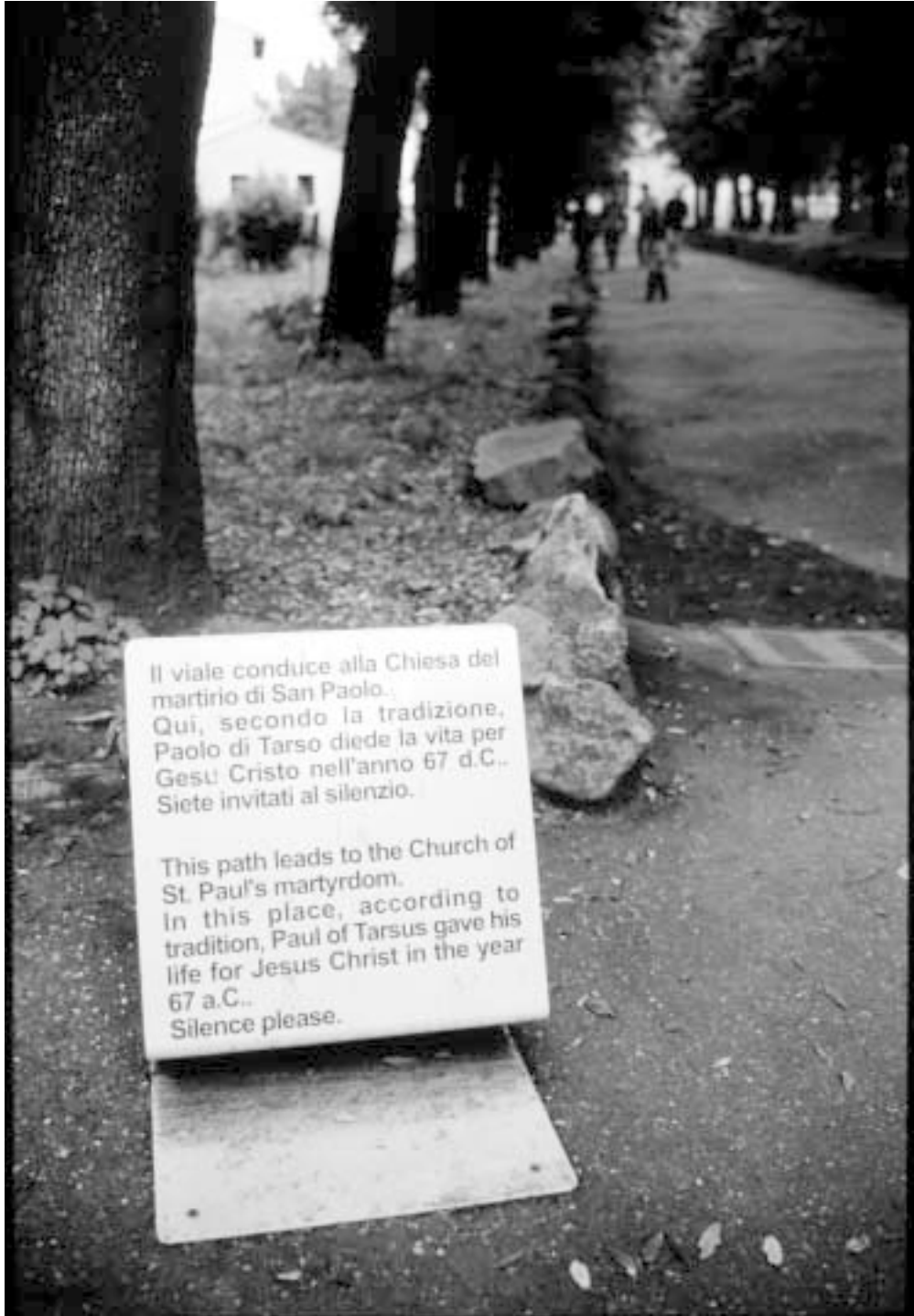
Trefontane, Rooma, Paavalin kuolinpaikka tradition mukaan.